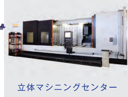
立体マシニングセンター