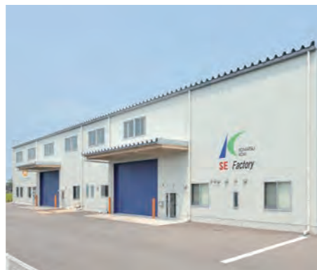
ロボットテクニカルセンター

テクニカルセンターではロボット整備、点検等を行っております。また当社の展示機でのロボット操作教育、サンプルワークを持ち込んでの溶接テスト等お客様の様々な要望にお応えしております。